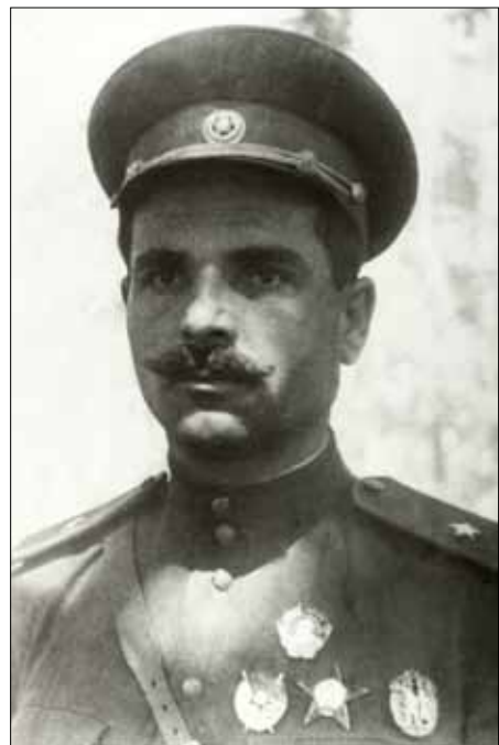
Семен Васильович Руднев. 1943 р.

За роки Великої Вітчизняної війни постала ціла плеяда талановитих полководців у лавах Червоної армії та організаторів партизанського руху опору в тилу ворога. Особливу увагу заслуговує комісар Сумського партизанського з'єднання Семен Васильович Руднев (27(15) лютого 1899 р. – 4 серпня 1943 р.). Будучи цілком відданим своїй справі, він, як того і вимагає військова присяга, ціною власного життя боронив рідну землю та народ від ворожого поневолення.