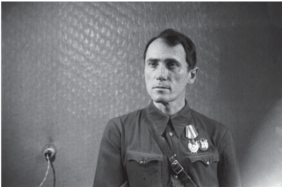
В. М. Сосюра, м. Київ, 1944 р. ЦДКФФА України ім. Г. С. Пшеничного, од. обл. 0-002838.