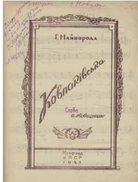
Пісня “Ковпаківська” на слова О. Новицького, музику Г. Майбороди, написана до 60-річчя С. А. Ковпака. 20 травня 1947 р. ЦДАГО України, ф. 241, оп. 1, спр. 8, арк. 13.

занських командирів, знуцання їх над партизанами та інші подібні факти. Отже, представлені на виставці документи дозволяють скласти повніше уявлення про роль Сидора Артемовича Ковпака у партизанському русі.