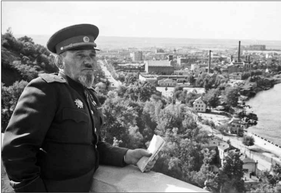
С. А. Ковпак на Володимирській гірці у м. Києві. Червень 1945 р. од. обл. 0-16669.

листок з обліку керівних кадрів та витяги із автобіографії С. А. Ковпака, заповнені власноручно в 1953 р. (ЦДАГО України, ф. 1, оп. 62, спр. 1742, арк. 126–127, 128–131 та зв.).